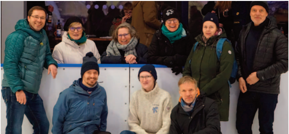
Eisstockschießen, Kühlungsborner MEERkampf am 24.1.26