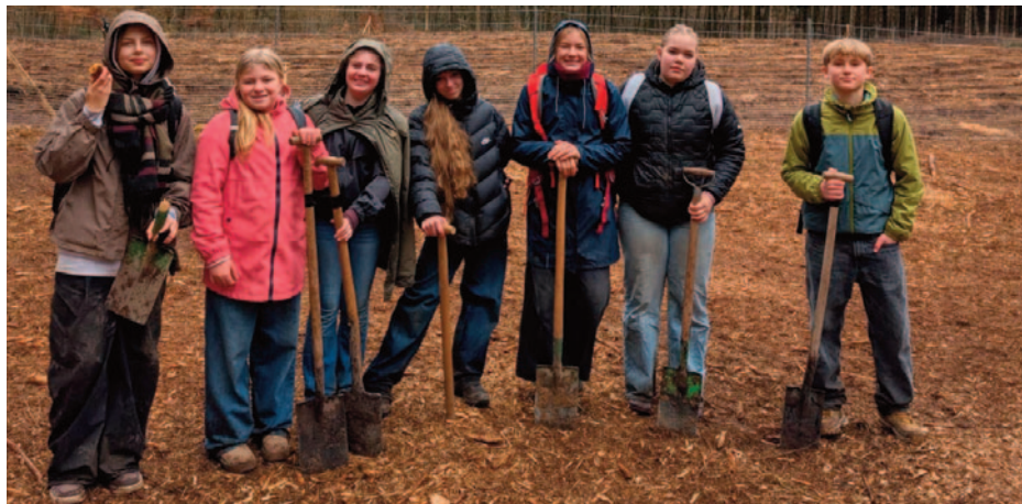
Klimacamp der Evangelischen Jugend Mecklenburg in Rittermanshagen 13.-15.3.26