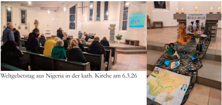
Weltgebetstag aus Nigeria in der kath. Kirche am 6.3.26