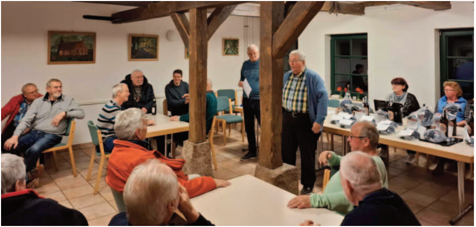
Seniorenkat, Kühlungsborner MEERkampf am 26.3.26 in der Pfarrscheune