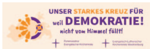
Tilman Jeremias Bischof im Sprengel Mecklenburg und Pommern