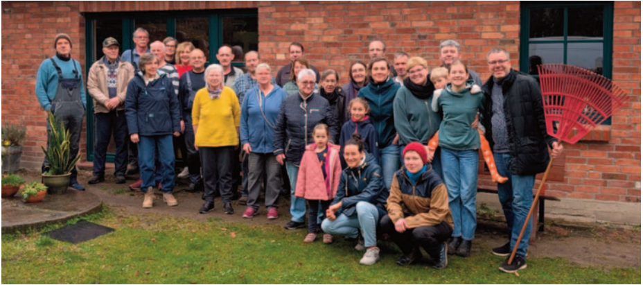
Arbeitseinsatz am 28.3.26 auf dem Alten Friedhof