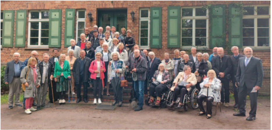
Goldene Konfirmation: Mit 55 Jubilaren wurde Pfingstsonntag gefeiert mit einem anschließenden Empfang auf der Festwiese.