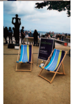
Ökumenischer Seebrückengottesdienst mit über 400 Gottesdienstbesuchern und anschließenden Aktionen der Kirche am Urlaubsort unter dem Motto Hoffnungsschimmer