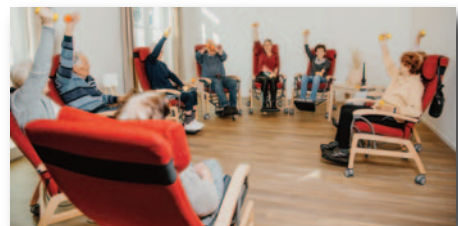
Zusammen fit bleiben: Eines der Angebote in der Tagespflege „Kiek mol rin“ der Diakonie Nord Nord Ost