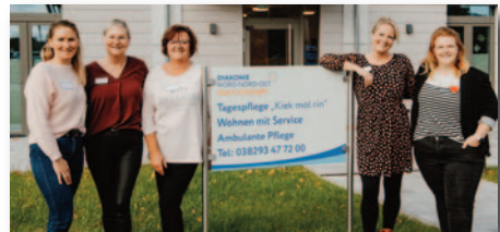
Das Team der Tagespflege freut sich auf seine Gäste.

Die Diakonie Nord Nord Ost bietet Menschen im Alter in Kühlungsborn seit vielen Jahren Pflege und Betreuung an – in der Seniorenpflegeeinrichtung „Amalie Sieveking“. Auch die ambulante Pflege mit Sitz in Neubukow können Pflegebedürftige im Ostseebad in Anspruch nehmen. Im neuen Gebäude, in dem die Tagespflege ihren Sitz hat, befinden sich zudem senioren-gerechte Wohnungen. Diese sind bereits alle vermietet. Hendrik Mulert