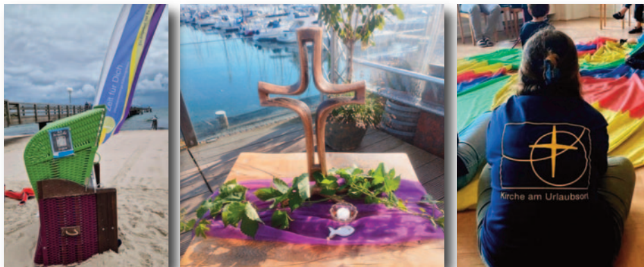
Kirche am Urlaubsort 2024 Ein herzliches Dankeschön an alle, die zum Gelingen der verschiedenen Angebote beigetragen haben!