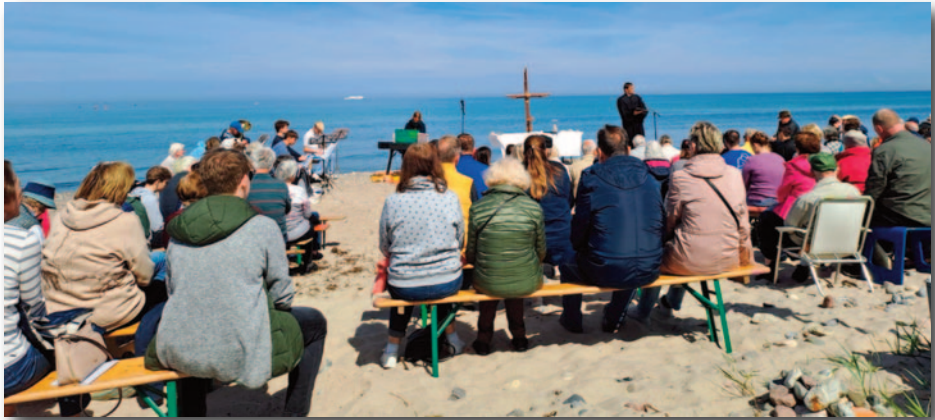
Himmelfahrtsgottesdienst am Strand von Kägsdorf am 9. Mai 2024