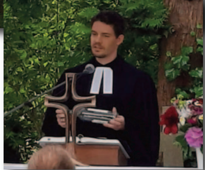
Regionalgottesdienst am Pfingstmontag auf der Festwiese an der Pfarrscheune