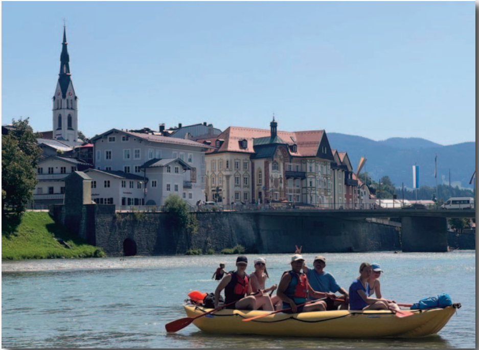
Familienpaddelfreizeit auf der Loisach vom 28.7. - 4.8. 24