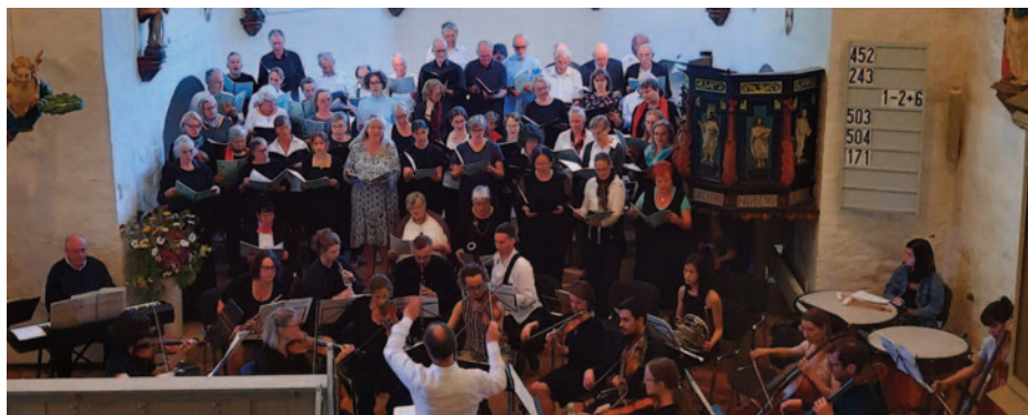
Mendelssohn Konzert in der St.-Johannis-Kirche am 29.6.24, Eröffnung der Sommermusiken

Wer mag, kann gerne einen Stollen, Plätzchen oder sonstige Leckereien mitbringen. Auch neu ist das Treffen am 12. Oktober um 16 Uhr für ein Mitmachensemble. Hier sind alle Leute, die ein Musikinstrument spielen, gefragt. Egal ob Flöte, Gitarre oder Klarinette alle Instrumente sind willkommen. Zur besseren Planung bitte ich um eine Anmeldung bis zum 7. Oktober unter sophie.feine@elkm.de . Da die Kinder immer mehr Zeit in der Schule verbringen und dort ein großes Nachmittagsangebot stattfindet, werde ich nun einmal pro Woche an der Grundschule in Kühlungsborn mit dem Kinderchor proben. So haben Eltern weniger Fahrwege und die Kinder haben die Möglichkeit, selbständig zum Chor zu kommen. Ich freue mich, wenn viele Kinder sich für das Projekt Kinderchor an der Grundschule anmelden und Freude am Singen haben. Hier wollen wir auch die Lieder für das diesjährige Krippenspiel einstudieren. Auf eine schöne musikalische Zeit. Herzliche Grüße Sophie Feine