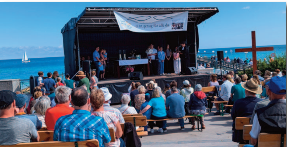
Seebrückengottesdienst am 14.7.24 unter dem Thema „Es ist genug für alle da“