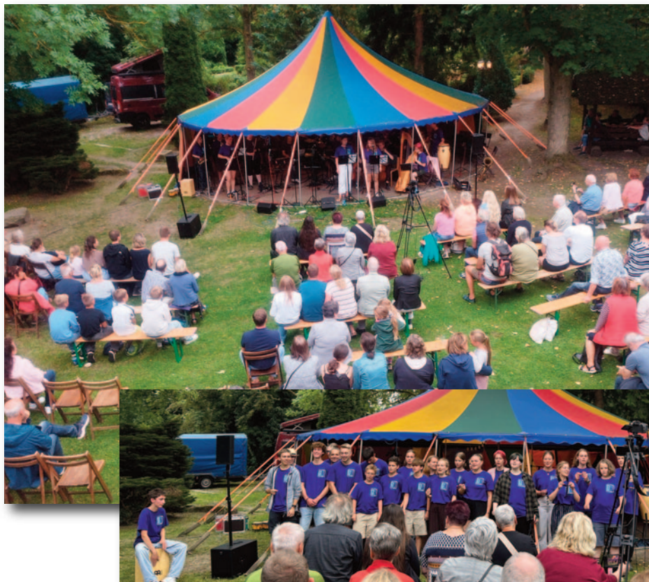
Musikprojekt Rock/Pop/Jazz von der Jugendkirche Rostock am 23.8.24 auf der Festwiese an der Pfarrscheune